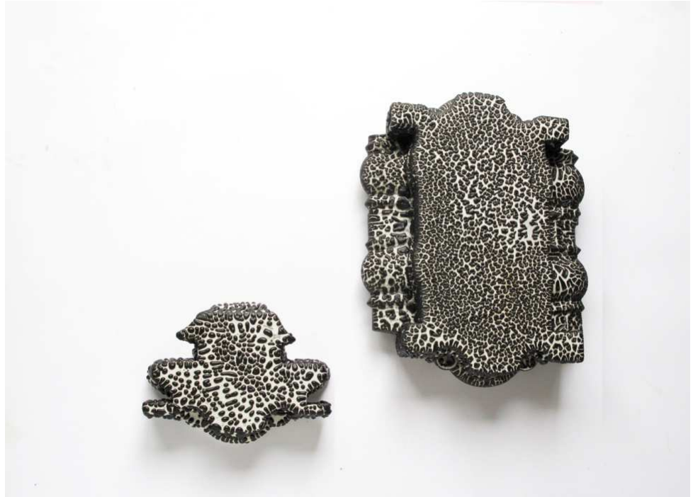
Philippe Barde PB/PB , 2011 Céramique, émail