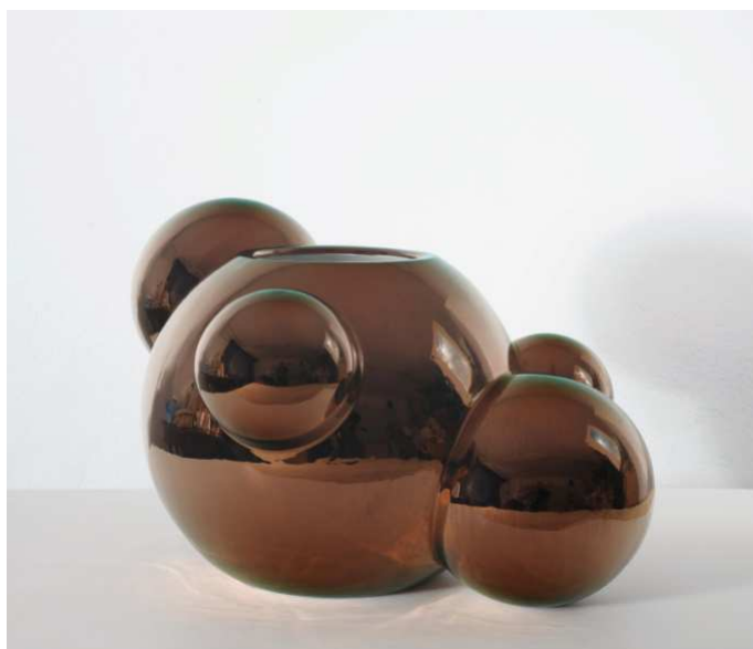
Alessandro Mendini, Tre sfere 2 – bronzo , 2006-2009 C ramique,  mail, bronze