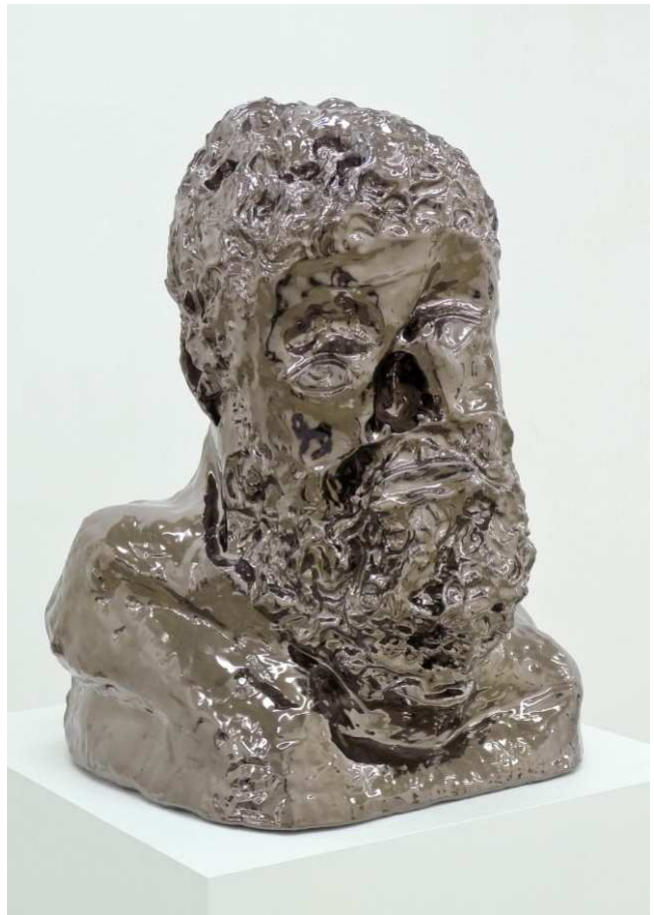
Christian Gonzenbach Elucreh Eserraf , 2010 Céramique, émail bronze